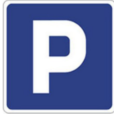
Znak: Zunanje javne površine