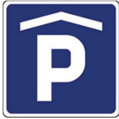
Znak: Podzemna parkirna hiša